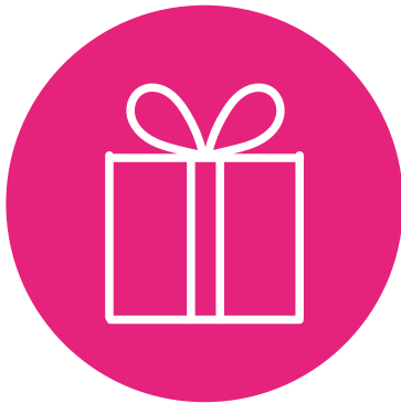
Regalos y hospitalidad

Esta sección de la política se refiere a 4 áreas: