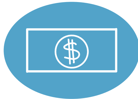
Facilitación de pagos